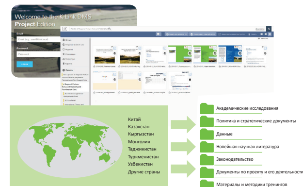
Коллекции библиотеки K-DMS Региональной пастбищной сети

Ядром РПС является онлайн-библиотека. В ней хранятся различные материалы и документы по пастбищной тематике. После того, как участник присоединится к сети, ему предоставляется пароль для входа в систему с использованием адреса его электронной почты. Библиотека позволяет осуществлять поиск статей по ключевым словам и сортировать их по странам и темам. Она также предоставляет отличную возможность для обмена документами, которые участники хотели бы распространить. Для этого достаточно просто загрузить новые файлы или обратиться с соответствующим запросом в Секретариат РПС по адресу rpn@klink.asia .