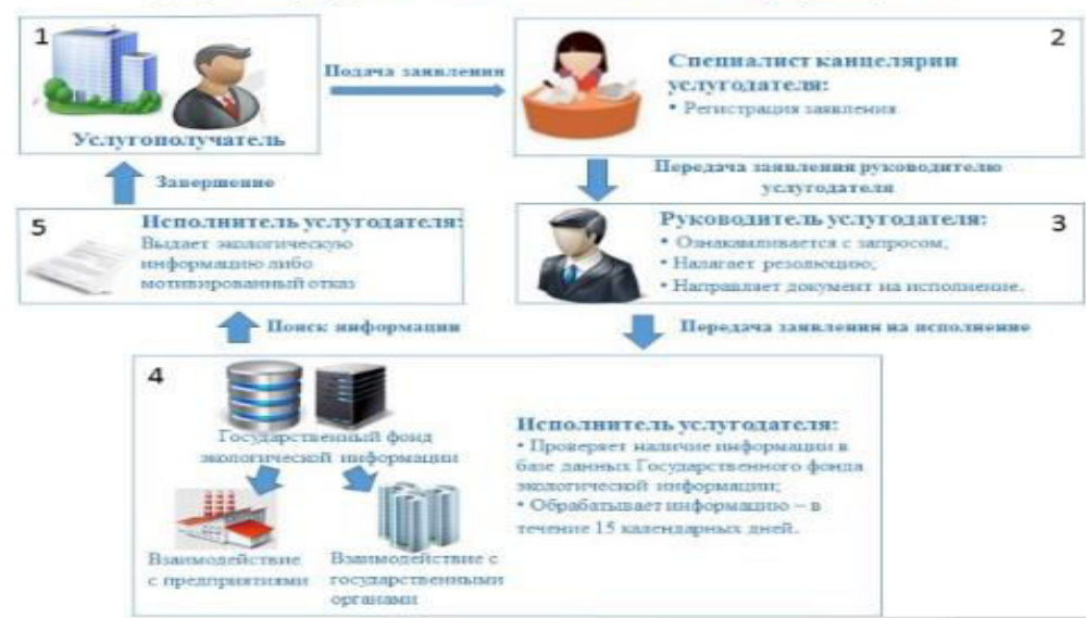
Схема функционального взаимодействия при оказании государственной услуги «Предоставление экологической информации»

В заявлении необходимо как можно более точно указать какая информация вас интересует. Можно выбрать информацию из реестров Государственного фонда экологической информации .